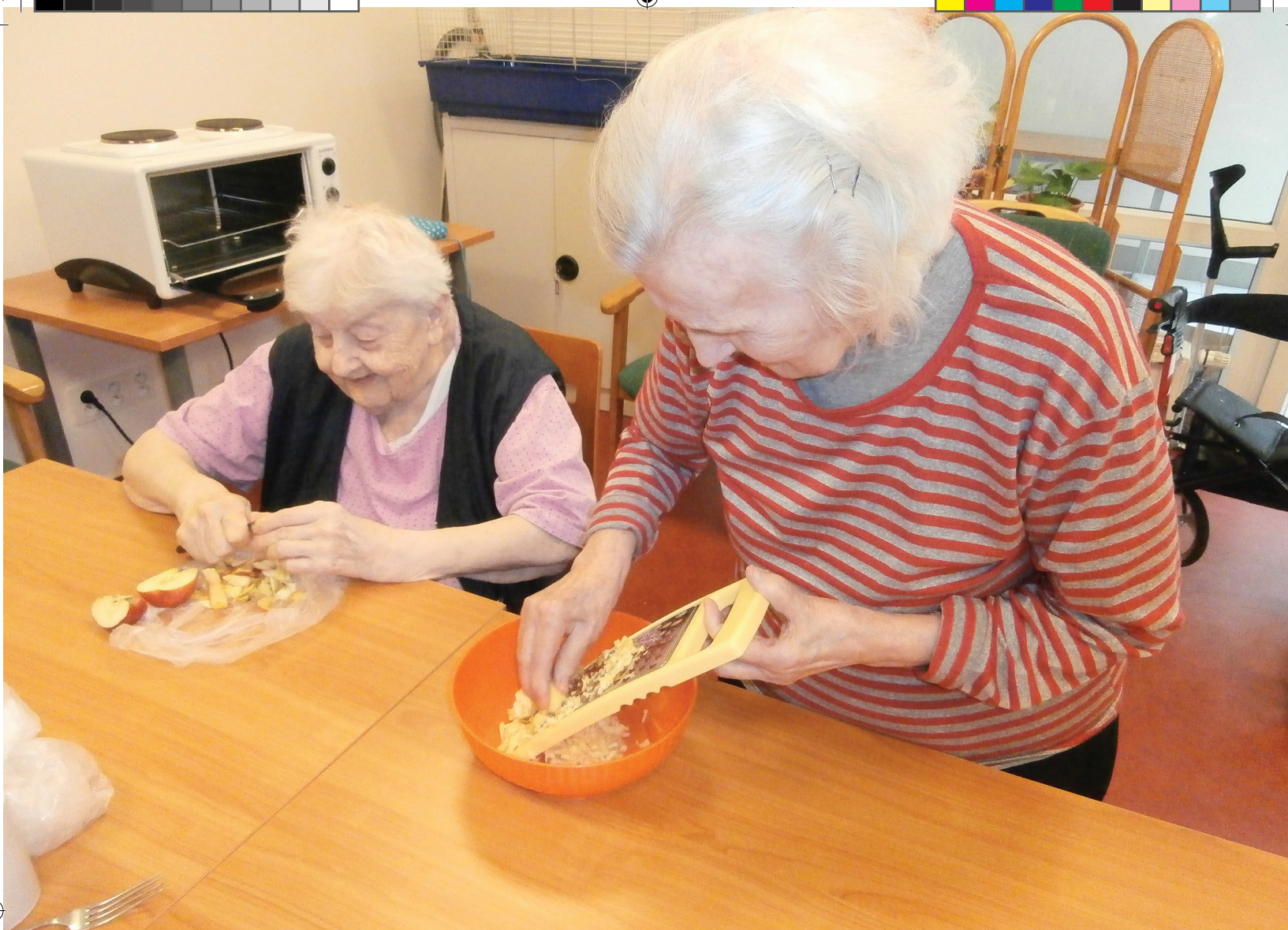
V denním stacionáři i vaříme a pečeme.