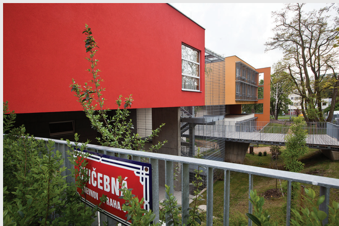
Nový Domov Eliška ve Cvičebné ulici na Břevnově