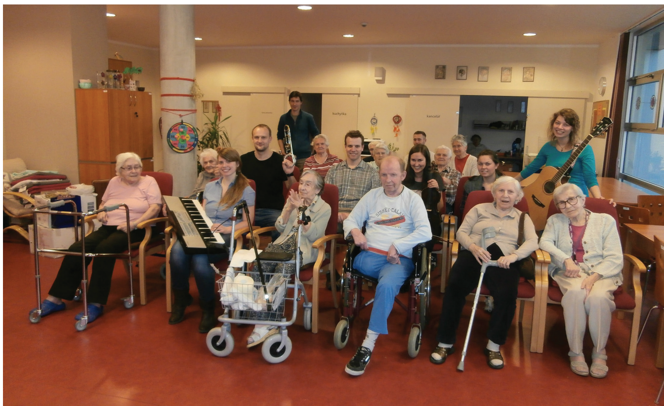
Studentská kapela Do hlubin