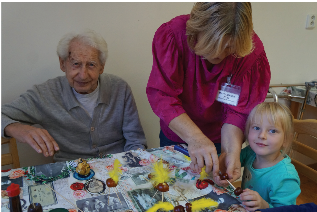
Návštěva dětí z mateřské školy