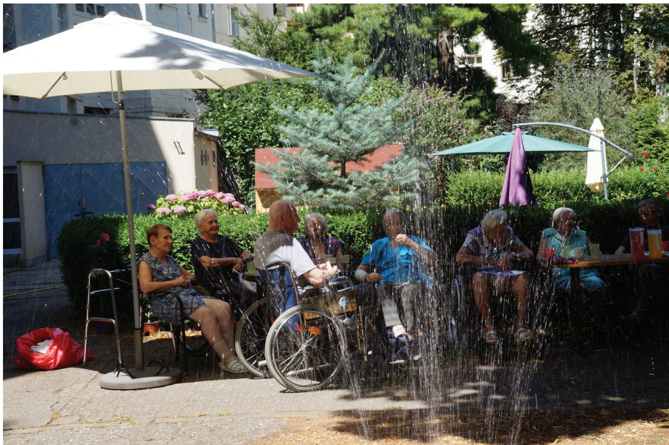
Na zahradě v Thákurově