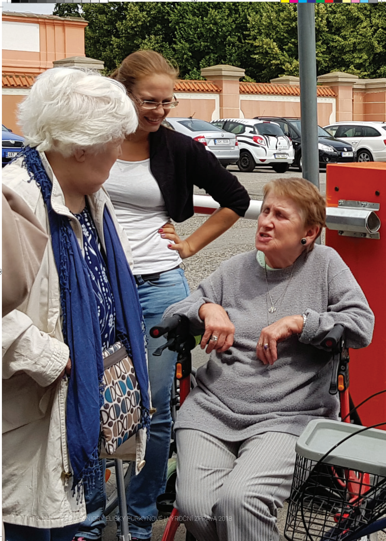
13 DOMOV PRO SENIORY ELIŠKY PURKYŇOVÉ | VÝROČNÍ ZPRÁVA 2018