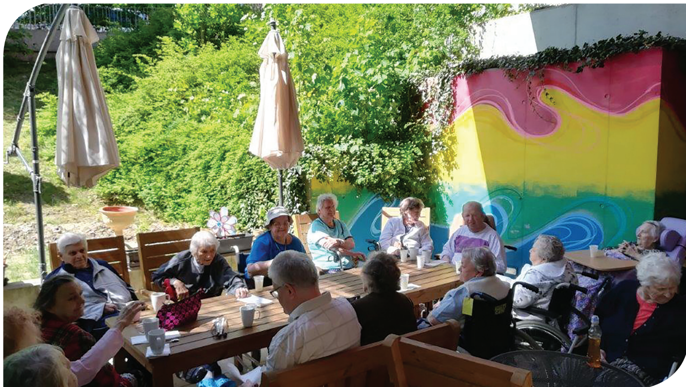
7 DOMOV PRO SENIORY ELIŠKY PURKYŇOVÉ | VÝROČNÍ ZPRÁVA 2018