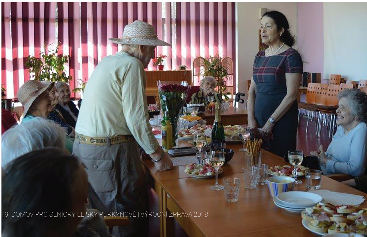
9 DOMOV PRO SENIORY ELIŠKY PURKYŇOVÉ | VÝROČNÍ ZPRÁVA 2018