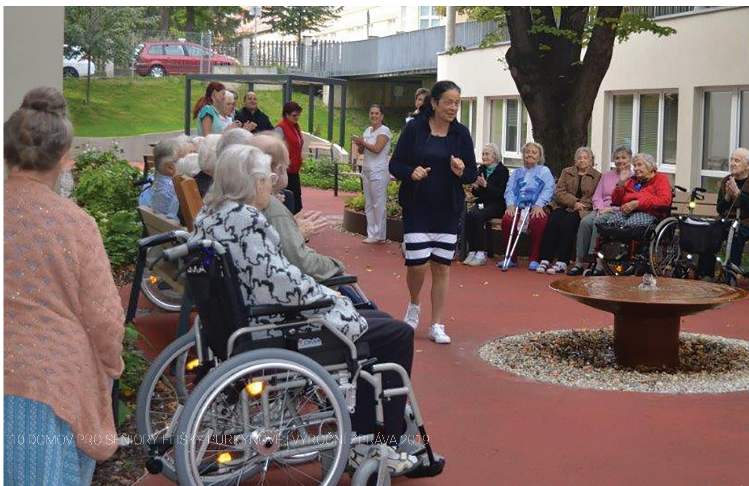
10 DOMOV PRO SENIORY ELIŠKY PURKYNŇOVÉ | VÝROČNÍ ZPRÁVA 2019