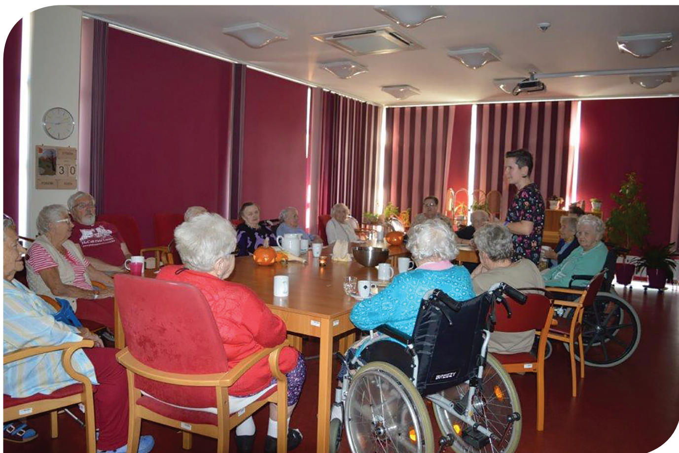
22 DOMOV PRO SENIORY ELIŠKY PURKYŇOVÉ | VÝROČNÍ ZPRÁVA 2019