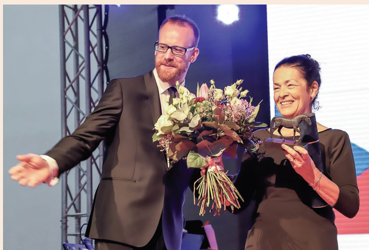
Předávání čestného občanství Prahy 6