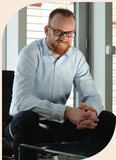
Mgr. Ondřej Kolář starosta Městské části Praha 6