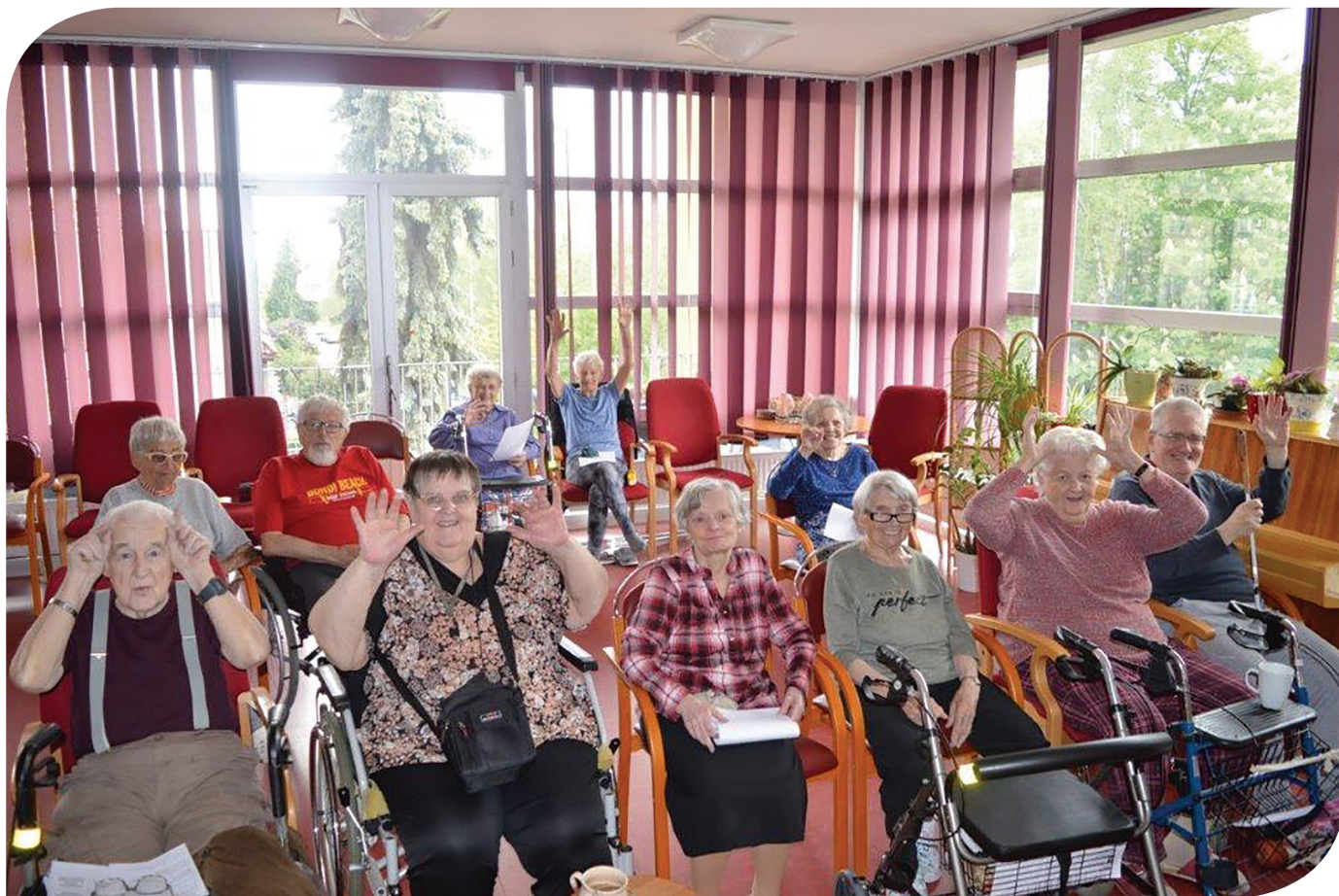
8 DOMOV PRO SENIORY ELIŠKY PURKYŇOVÉ | VÝROČNÍ ZPRÁVA 2019

Zajistili jsme provedení čištění skleněných odhlučňovacích bariér na objektu a přilehlém pozemku.