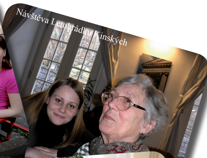
Návštěva Letohrádku Kinských