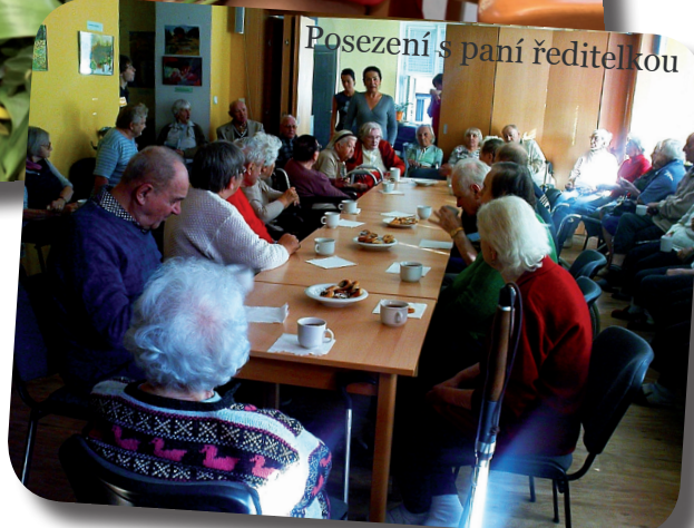
Posezení s paní ředitelkou