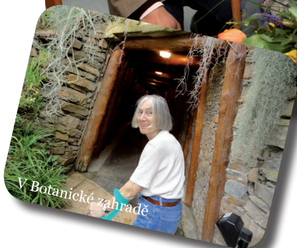
V Botanické zahradě