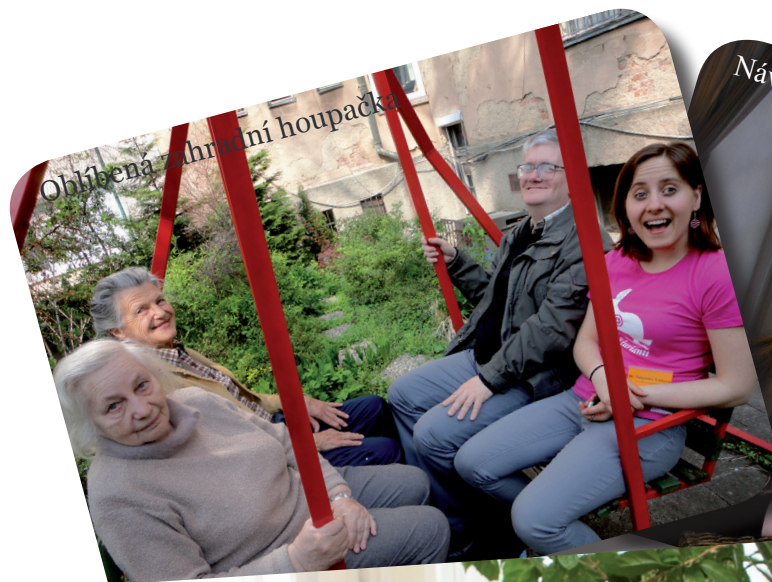
Ohlíděna zahrádní houpačka